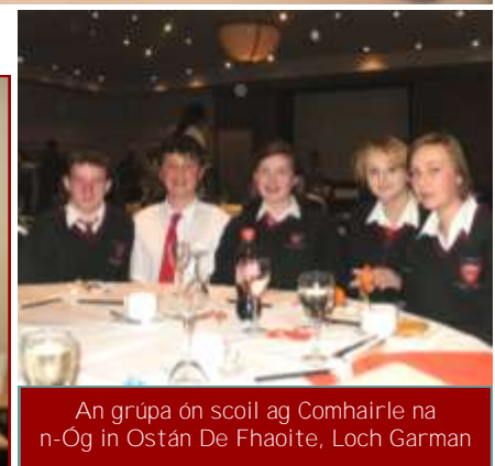
An grúpa ón scoil ag Comhairle na n-Óg in Ostán De Fhaoite, Loch Garman